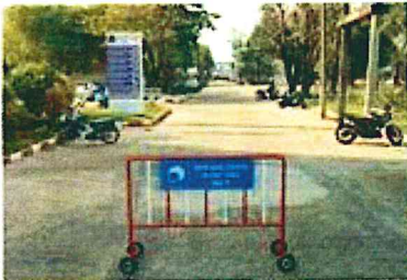
สขช.ธาตุพนม