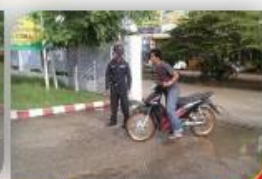
สขจ. พิมาย

โครงการ DLT Helmet Area สวมหมวกนิรภัย 100%