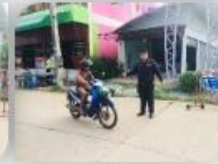
สขจ. ด่านขุนทด