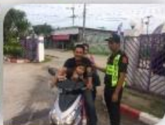
สขจ. ปากช่อง