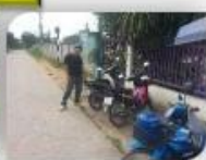
สขจ. บัวใหญ่