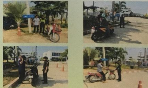
สำนักงานขนส่งจังหวัดบุรีรัมย์ สาขาพุทไธสง

โครงการ DLT Helmet Area สวมหมวกนิรภัย 100%