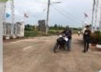
สขจ. ปักธงชัย