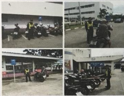
สำนักงานขนส่งจังหวัดบุรีรัมย์