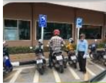
สขจ.นม. แห่งที่ 1

สำนักงานขนส่งจังหวัดนครราชสีมาแห่งที่ 1, 2 และสำนักงานขนส่งทั้ง 7 สาขา ขอรายงานผลการดำเนินงาน ดังนี้ ประจำเดือน สิงหาคม 2561 จำนวนผู้ใช้รถจักรยานยนต์ทั้งสิ้น 5,951 คัน ผู้ขับขี่รถจักรยานยนต์ที่สวมหมวกนิรภัย ทั้งสิ้น 5,816 ราย คิดเป็นร้อยละ 97.73 ผู้ขับขี่รถจักรยานยนต์ที่ไม่สวมหมวกนิรภัยจำนวน 35 ราย คิดเป็นร้อยละ 2.27