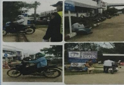
สำนักงานขนส่งจังหวัดบุรีรัมย์ สาขานางรอง